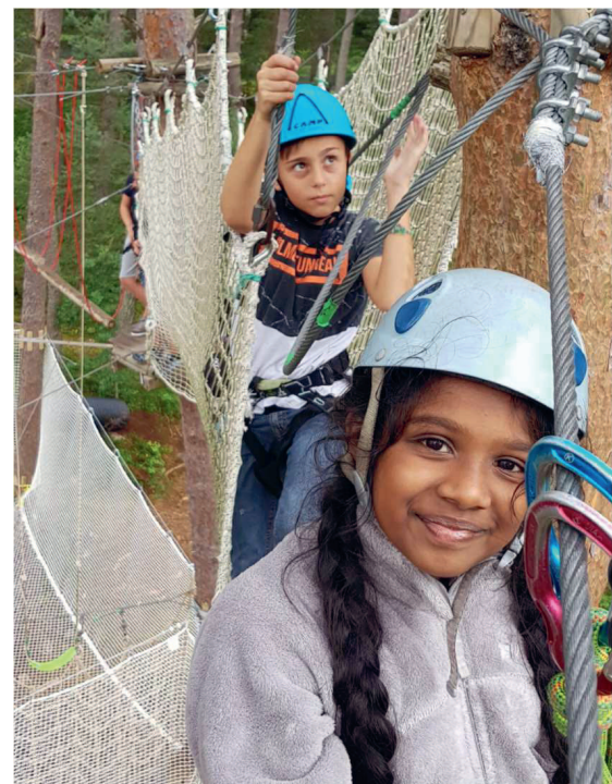
Un sourire qui en dit long

Merci au soutien indéfectible de nos fidèles partenaires (La France Mutualiste, la Fédération des Clubs de la Défense, Unéo, Terre-Fraternité, l'Association pour le Développement des Œuvres Sociales de la Marine, les mutuelles Nationale Militaire et de l'Armée de l'Air) grâce auxquels ces stages ont pu être financés.