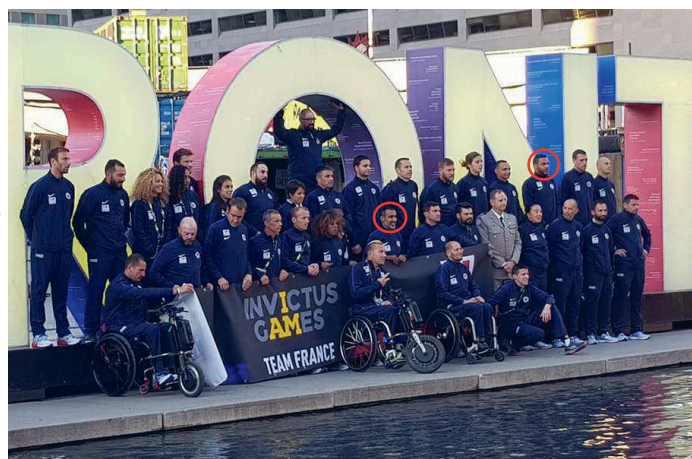
La délégation française

La délégation française termine avec un total de 36 médailles, 13 Or, 12 Argent et 11 Bronze.