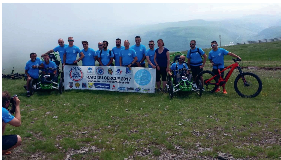
Les participants au Raid Auvergne 2017

CSINI - Sirpa Air- ECPAD- Gérald KNIGHTS