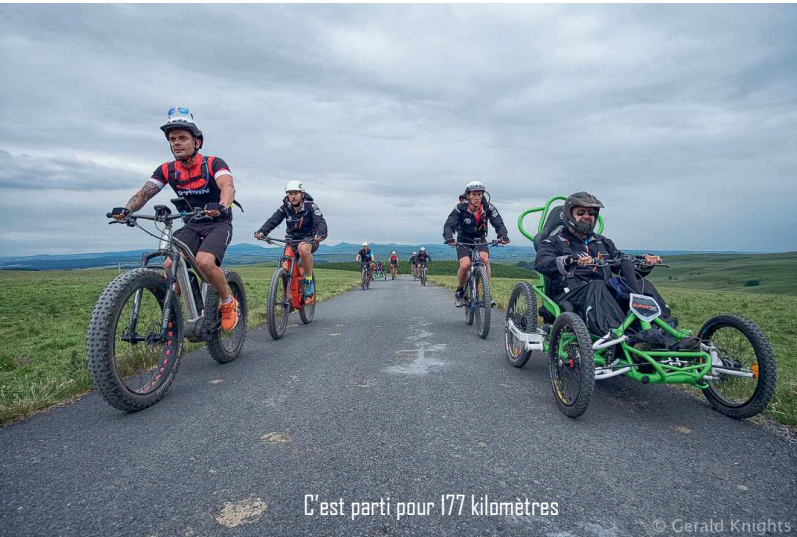
C'est parti pour 177 kilomètres