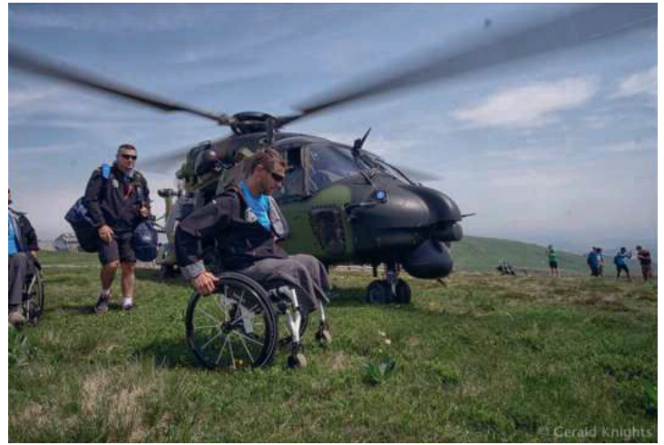
Hélicoptage au sommet du plomb du Cantal en Caiman NH 90

Après le raid Dream Vercors organisé en 2015, le CSINI a mis le cap cette année sur l'Auvergne. Du 23 au 28 juin 2017 huit militaires blessés des trois armées (Terre, Air et Mer) et un encadrement « retailé » ont arpenté le massif des volcans. Le jour du départ du raid coïncidait avec la journée des blessés de l'armée de Terre, décrétée par le CEMAT.